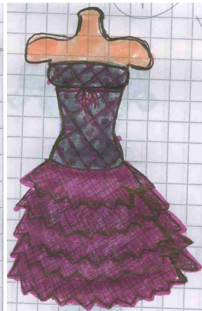
Abito grigio e fucsia