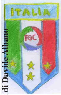
Illustrazioni di Davide Albano