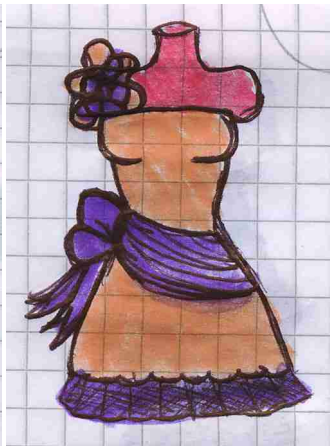
Abito rosa carne e lilla