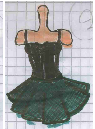
Abito verde con pelle nera