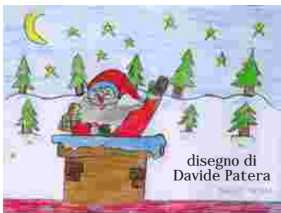
disegno di Davide Patera

Il Natale, per noi cristiani, è una festa molto importante perché ricorda la nascita di Gesù Bambino, venuto al mondo per salvare l'umanità dal peccato.