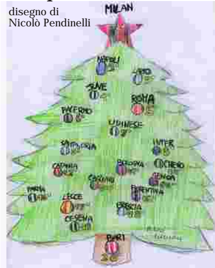
disegno di Nicolò Pendinelli