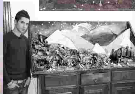
Il Presepe realizzato da Marco Ingrosso